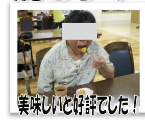
美味しいと好評でした！